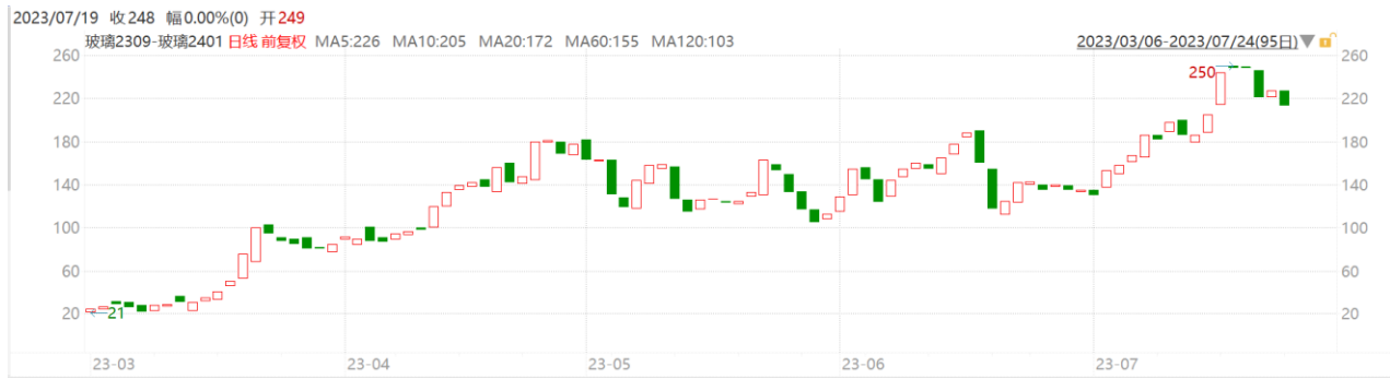
图表 3：玻璃 9-1 合约价差